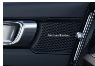
• harman/kardon®プレミアムサウンド・オーディオシステム(600W、13スピーカー)サブウーファー付

特別仕様車 EX40 Ultra Single Motor Classic Edition