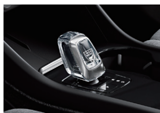
• オレフォス®社製クリстал・シフトノブ