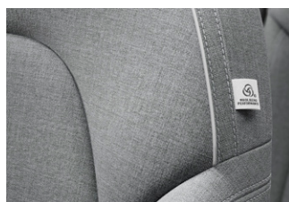
• テイラード・ウール・ブレンド