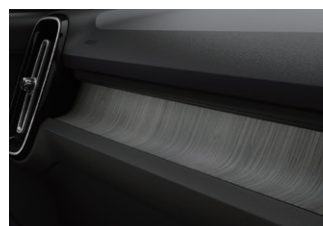
• ドリフト・ウッド・パネル