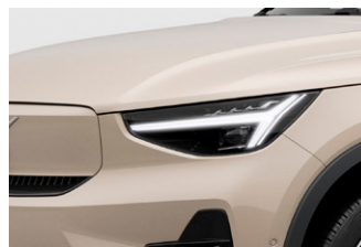
• ピクセルLEDヘッドライト (フル・アクティブ・ハイビーム付)