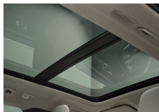
• チルトアップ機構付 電動パノラマ・ガラス・サンルーフ