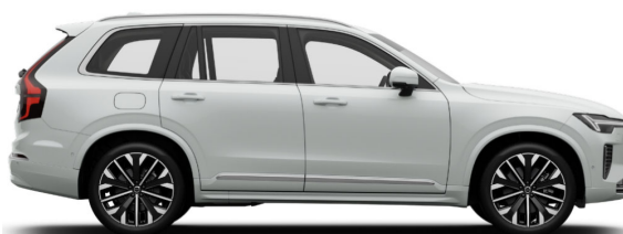
707 Crystal White