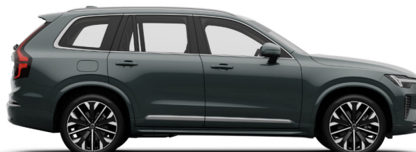
746 Forest Lake