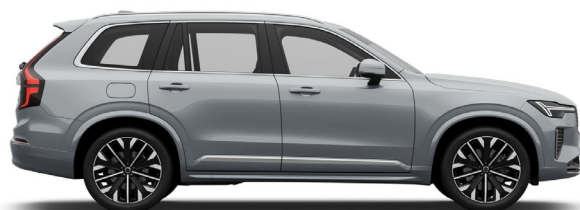
740 Vapour Grey