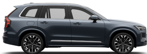
723 Denim Blue