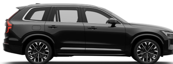
717 Onyx Black