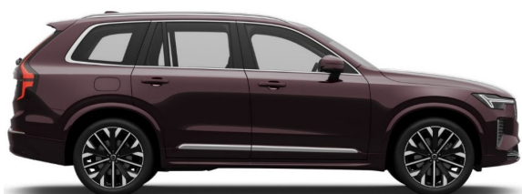
739 Mulberry Red