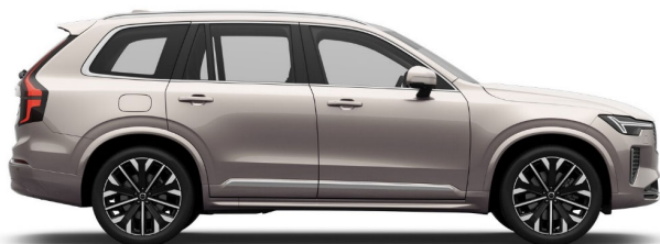
736 Bright Dusk