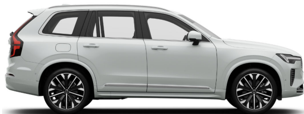
614 Ice White