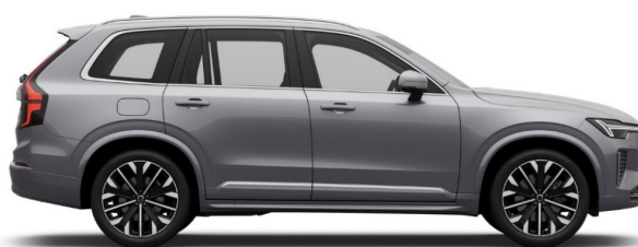
745 Aurora Silver