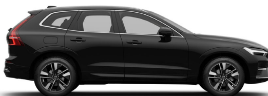
717 Onyx Black