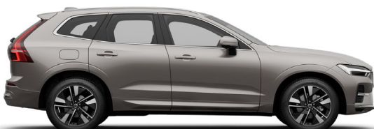
736 Bright Dusk