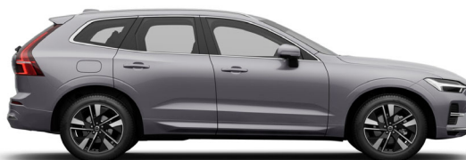
745 Aurora Silver