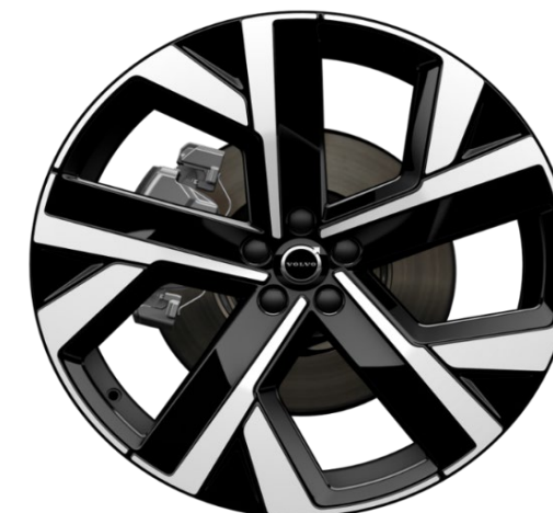
22" 5-Double Spoke Glossy Black Diamond Cut