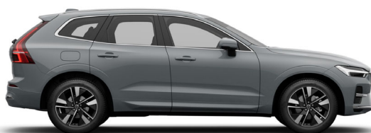
740 Vapour Grey