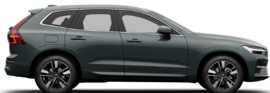
746 Forest Lake