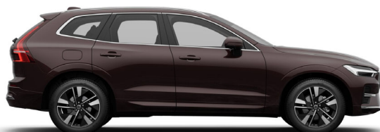
739 Mulberry Red