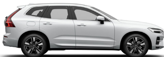
707 Crystal White