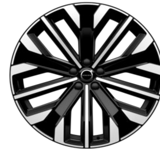
21" 5-multi spoke black diamond cut