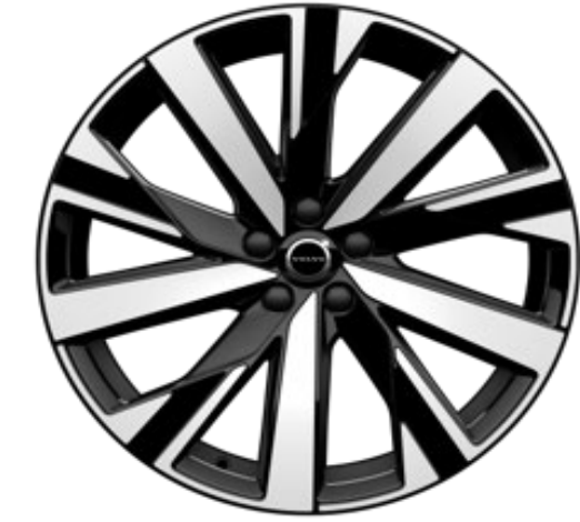
20" 5-multi spoke black diamond cut