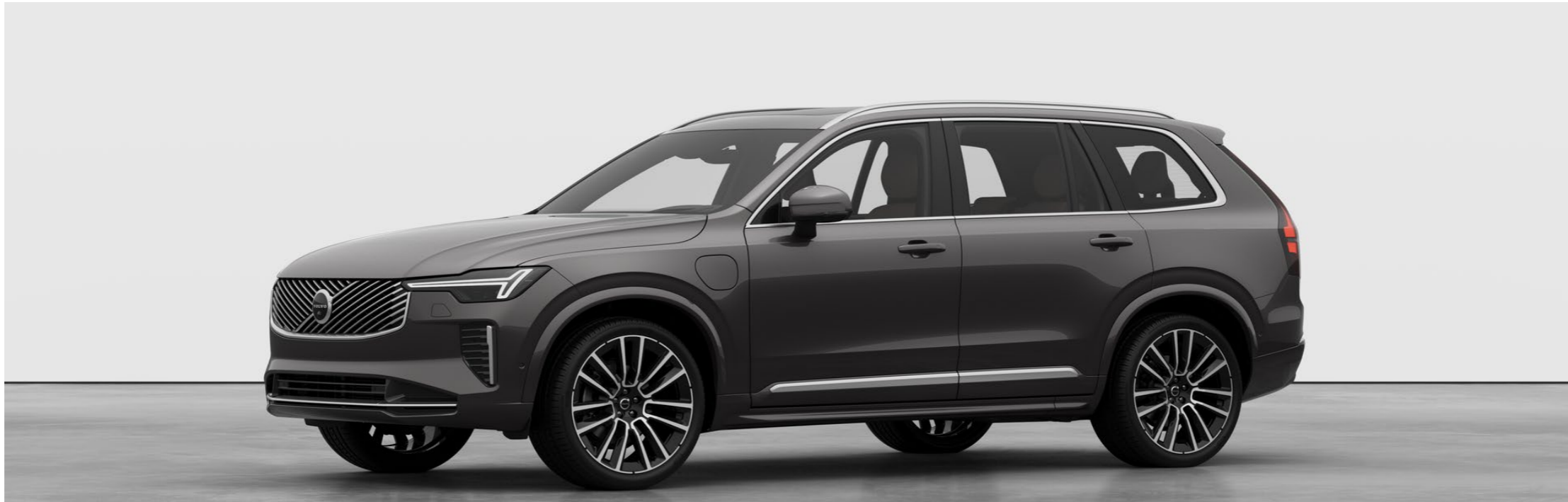
Kuvien autot lisävarustein.

Ilmoitetut verotusarvot koskevat kalenterivuotta 2026.