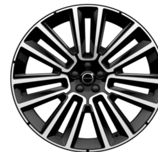
22" 7-double spoke black diamond cut