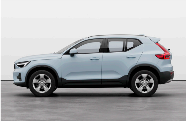
XC40 Plus B3