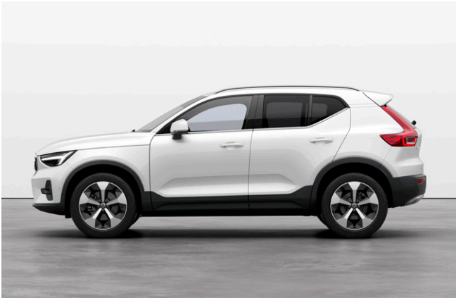
XC40 Ultra B4 AWD