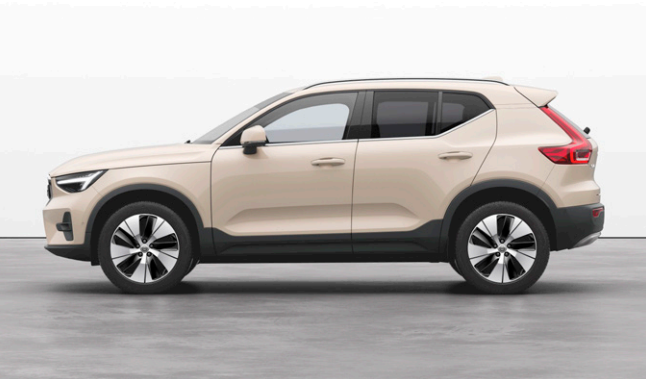
XC40 Ultra B3