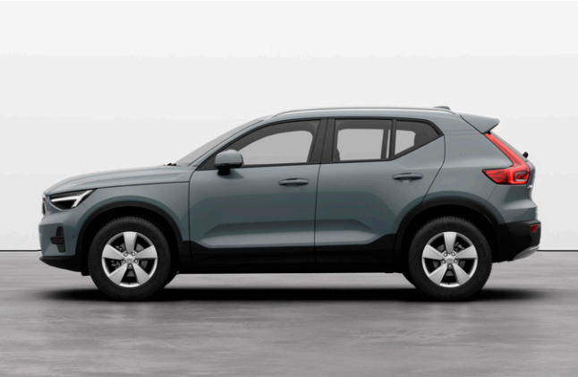
XC40 Essential B3