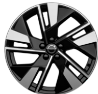
5ダブルスポーク 7.5J×19インチ ダイヤモンドカット/グロッシーブラック