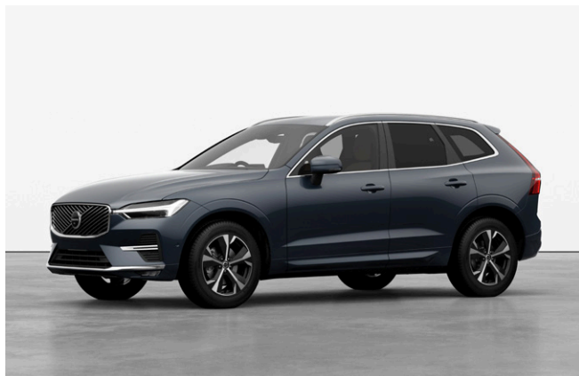
XC60 Plus B5 AWD