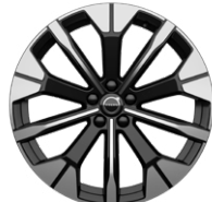
5 Yスポーク 20インチ アルミホイール 8.0J×20インチ ダイヤモンドカット/グロッシーブラック