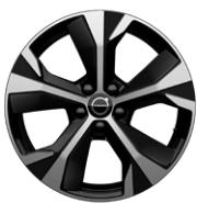
5スポーク 7.5J×18インチ ダイヤモンドカット/グロッシーブラック