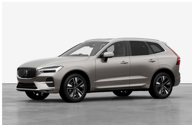
XC60 Ultra B5 AWD