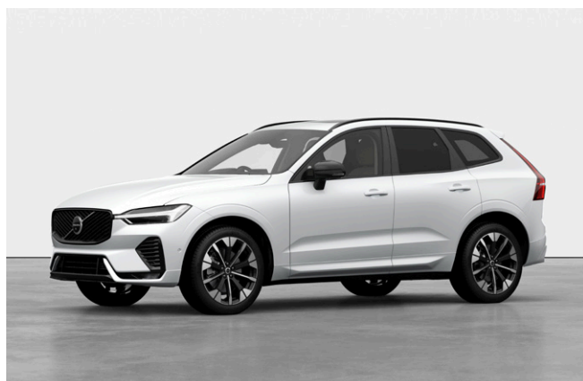
XC60 Ultra B5 AWD Dark Edition