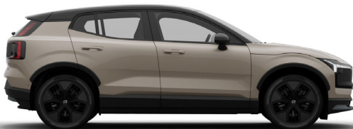
743 Sand Dune