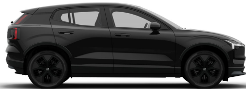
717 Onyx Black