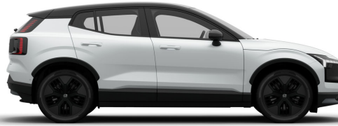
707 Crystal White