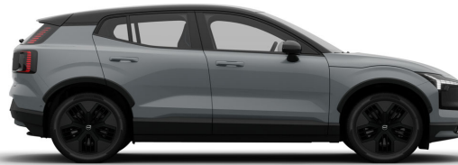
740 Vapour Grey