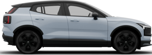
626 Cloud Blue