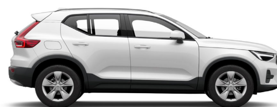
707 Crystal White