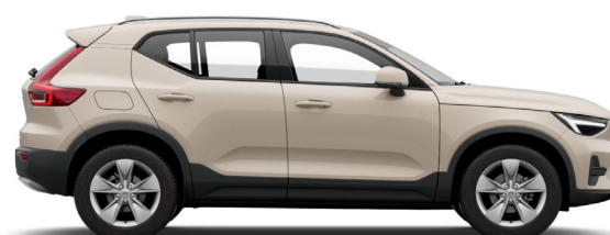
743 Sand Dune