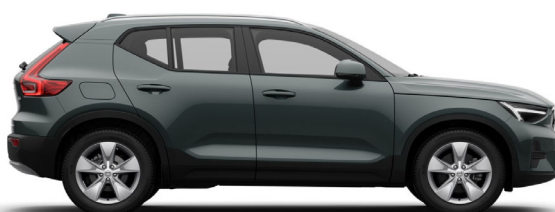
746 Forest Lake