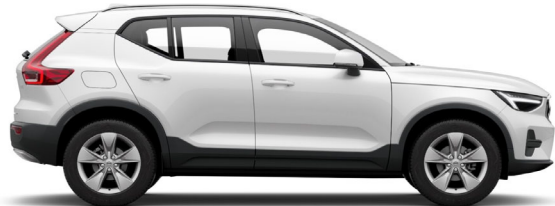
707 Crystal White