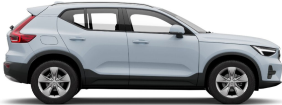
626 Cloud Blue