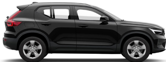
717 Onyx Black