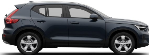
723 Denim Blue