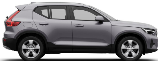
745 Aurora Silver