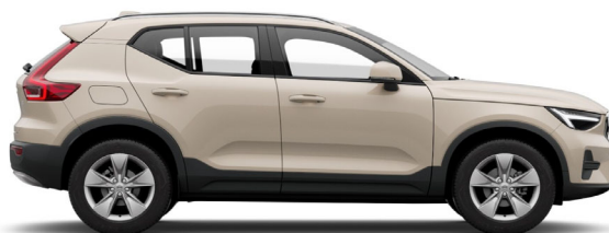
743 Sand Dune