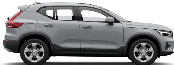
740 Vapour Grey