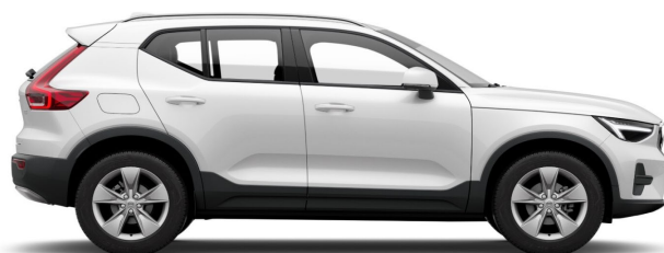
707 Crystal White