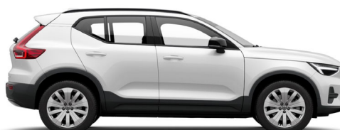
707 Crystal White