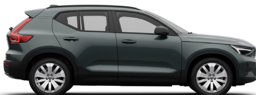
746 Forest Lake