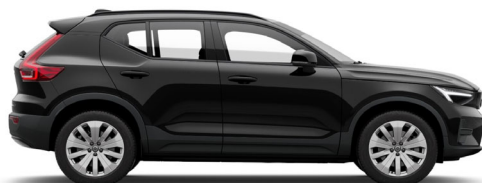
717 Onyx Black