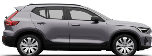
745 Aurora Silver