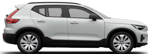
614 Ice White