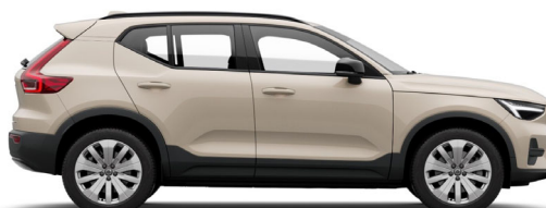
743 Sand Dune