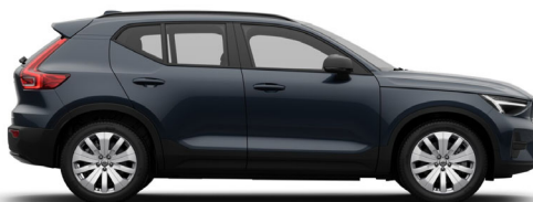
723 Denim Blue