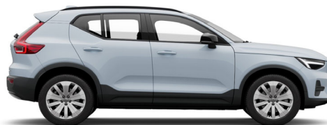
626 Cloud Blue