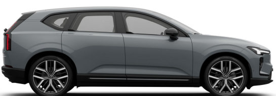
740 Vapour Grey