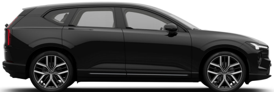
717 Onyx Black