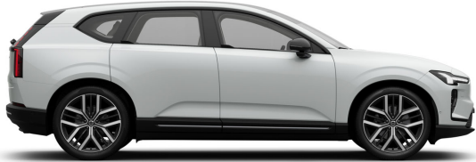
614 Ice White