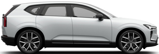
707 Crystal White