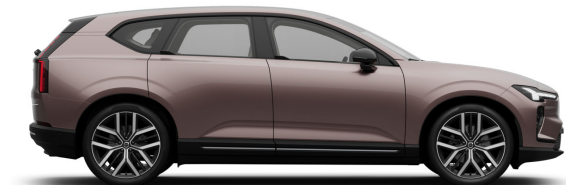
750 Heather Bronze