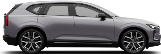
745 Aurora Silver