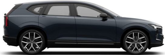
723 Denim Blue