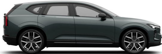
746 Forest Lake