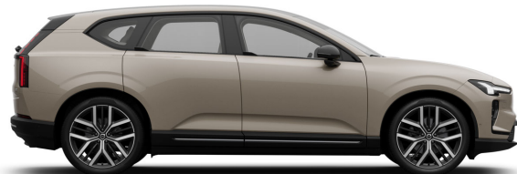
743 Sand Dune