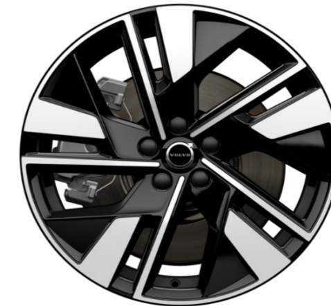
19" 5-double spoke glossy black diamond cut