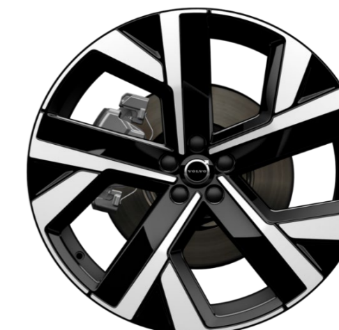
22" 5-double spoke glossy black diamond cut