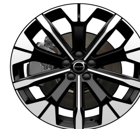
20" 5-Y spoke glossy black diamond cut