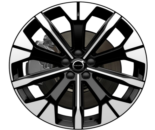
20" 5-Y spoke glossy black diamond cut