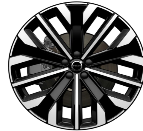
21" 5-V spoke glossy black diamond cut