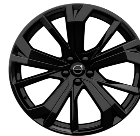
21" 5-Double Spoke Glossy Black