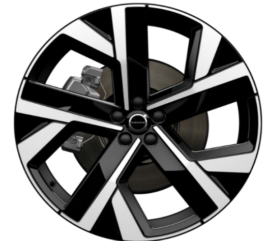
22" 5-double spoke glossy black diamond cut