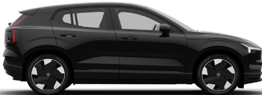
717 Onyx Black