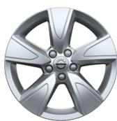
5スポーク 7.5J×17インチ シルバー