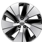
5-スポーク 7.5J×18インチ ダイヤモンドカット/ブラック