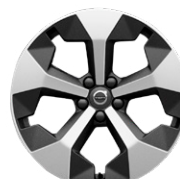
5-Yスポーク 7.5J×19インチ ダイヤモンドカット/マットグラファイト