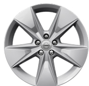
5スポーク 7.5J×18インチ シルバー